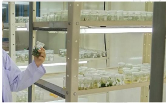
ห้องปฏิบัติการภาควิชาชีววิทยา