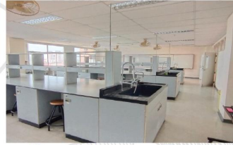
ห้องปฏิบัติการภาควิชาเคมี