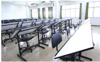
ห้องปฏิบัติการทางสถาปัตยกรรม