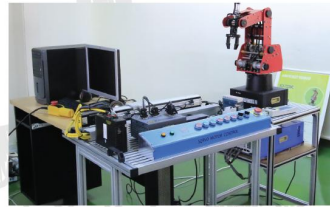
ห้องปฏิบัติการระบบอัตโนมัติ