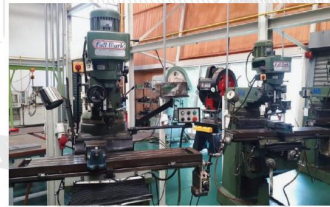
ห้องปฏิบัติการทางวิศวกรรม