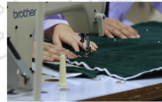
ห้องปฏิบัติการคหกรรม

โรงเรียนสาธิตนวัตกรรม มหาวิทยาลัยเทคโนโลยีราชมงคลธัญบุรี Innovation Demonstration School of RMUTT