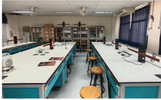
ห้องปฏิบัติการภาควิชาฟิสิกส์